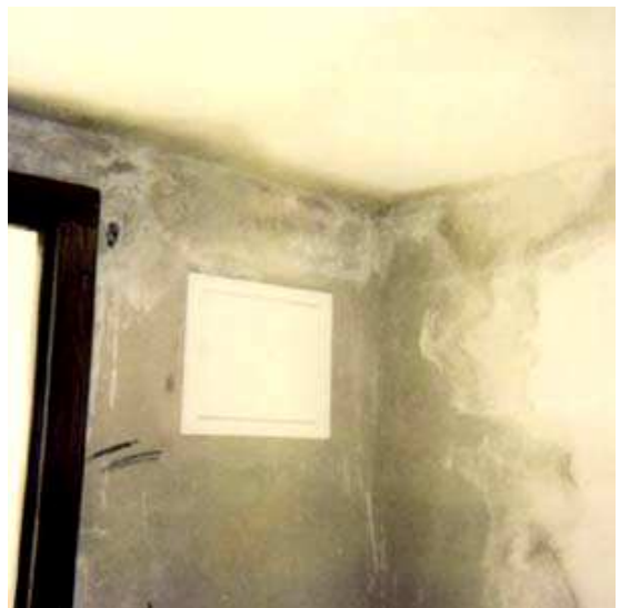
Bild 7.2.1. : Gipskalkputz im Kellerraum eines 1,5 Jahren Einfamilienhauses