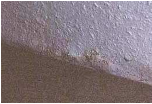
Bild 6.4.2.: Zersetzung der Raufasertapete über den Fußboden an der Außenwand

Im Bild 6.4.2. ist die Zerstörung der Tapete an der Außenwand über dem Fußboden erkennbar. Hier bildete sich Kondenswasser, was auch noch durch Baufeuchte nach der Sanierung begünstigt wurde. In dem Fall wurde der Raum im Winter durch die wärmere Raumluft eines anderen Zimmers beheizt. In der Anlage 4 ist sehr deutlich zu erkennen, wenn die Temperatur der Luft sinkt, so steigt die relative Luftfeuchte. Grundsätzlich ist jeder Raum eigenständig zu beheizen und wenn es nur zur Temperierung der